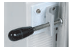
Optional: Stativhalterung für BFM-900