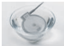
Sonden für Unterwasser-CTG's